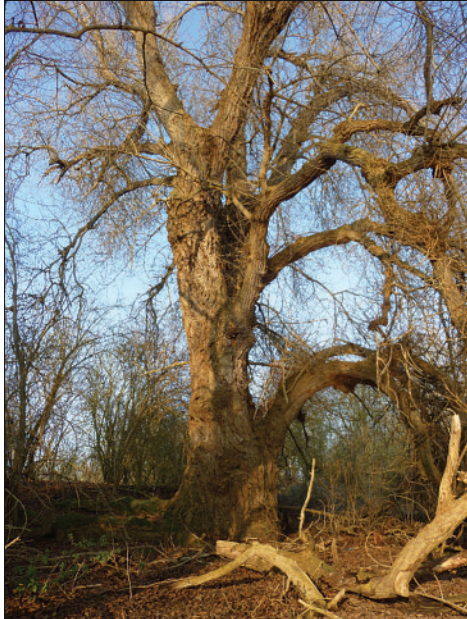
Photo 2 Vieux peuplier noir sur la Seine dans la commune des Muids dans l'Eure (circonférence = 650 cm).