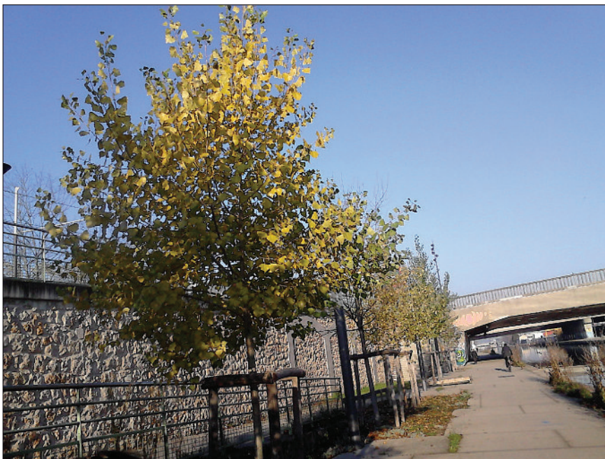
Photo 4 Variété en mélange de clones Seine sur le canal Saint-Denis (Paris).