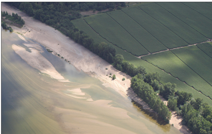
Photo 1 Étroite ripisylve à Peuplier noir de Loire, zone tampon entre l'espace terrestre (occupé par l'agriculture) et le milieu aquatique.

Longtemps confondu et mis à l'écart par le Peuplier hybride de culture, le Peuplier noir ( Populus nigra L.) suscite un regain d'intérêt. Cette espèce fait partie d'un habitat naturel particulier : la forêt alluviale à bois tendre (ripisylve, photo 1, ci-dessous), habitat qui est le support d'une biodiversité remarquable (Piégay et al. , 2003 ; Naiman et al. , 2005). Les caractéristiques biologiques de cette espèce sont présentées dans Villar et Forestier (2009). Suite aux menaces exercées sur le Peuplier noir et son habitat, un programme national de conservation des ressources génétiques a été défini et mis en place par la commission des Ressources génétiques forestières (CRGF) en 1992 sous l'égide du ministère de l'Agriculture et de l'Alimentation. L'objectif principal est de conserver les gènes fondateurs de la variabilité actuelle et de préserver au mieux les adaptations locales comme les mécanismes naturels qui la sous-tendent. Cet article présente les avancées majeures de ce programme depuis 9 ans (Villar et Forestier, 2009).