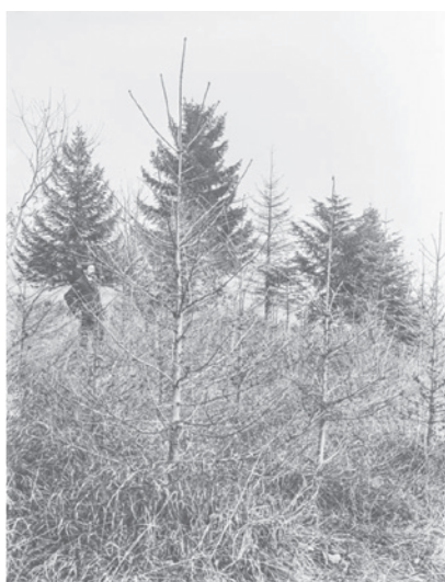
Photo 1 | Dépérissements de jeunes épicéas liés à la sécheresse de 1911 dans une plantation à Hägendorf (canton de Soleure, Suisse) (Rathgeb et al. , 2020)

1989-1993 et plus récemment 2014-2019 sont parmi les périodes les plus sèches jamais enregistrées en Europe occidentale et centrale (Moravec et al. , 2021).