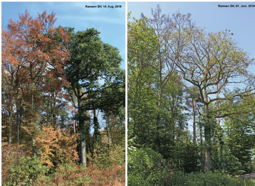
Photo 2 | Lisière d'une forêt près de la commune de Ramsen dans le canton de Schaffhouse au Nord de la Suisse, en août 2018 (à gauche) et en juin 2019 (à droite)

Bien que les trois causes de dépérissement puissent agir simultanément, la mort des arbres ne se produit souvent pas la même année que la sécheresse et prend généralement plusieurs années. Les impacts secondaires (ravageurs et pathogènes) agissent alors comme un catalyseur dans ce processus de dépérissement décrit comme une